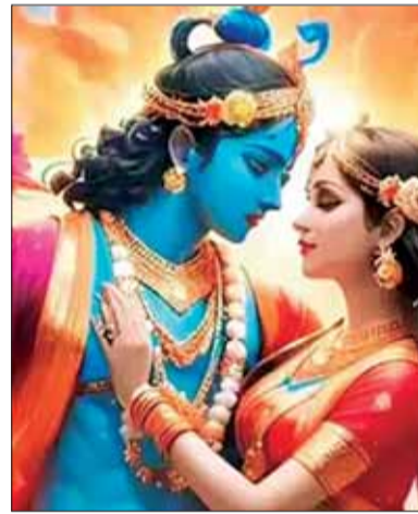
भगवान पधारं और पूरे ब्रज में जन्मोत्सव ऐसे मनाया गया जैसे घर-घर में लाला का जन्म

जबलपुर। श्रीमद् भागवत महापुराण सप्ताह ज्ञान यज्ञ के पंचम दिवस स्वामी जी ने कहा परमात्मा अजन्मा है उसका जन्म नहीं होता पर भक्तों के लिए वह जन्म भी धारण करता है। आनन्दित करते हैं। निशीथे तम उद्भूते जायमाने जनार्दने भगवान जनार्दन के रूप में प्रगट हुए, जनार्दन अर्थात् जो जन जन का परम कल्याण करने वाला है। भगवान चतुर्भुज रूप में महाराज वसुदेव जी को दर्शन दिये, पर जब वसुदेव व देवकी दोनों ने भगवान की स्तुति करते हैं उस समय भगवान "बभ्रूव प्राकृतः शिशुः" प्राकृत शिशु बन गये। मथुरा से ब्रज में